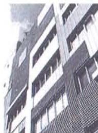
積層張り、ルーバー、鍍金、双張りなどさまざまな手立てで木質パネルを張った木材館

同協議会は、大阪府立大学屋上にウッドデッキを、大阪木材会館(既存)の外壁に間伐材パネルを張り、木材によるヒートアイランド対策を調査した結果、日中、木質パネルの表面は高温になっても、夜間放熱が低減する。夜対策(空調負荷の低減)につながる事がわかった。外装材に使用する木材はスノキなどの間伐材だが、200℃前後の加熱処理を行うため、防腐性(ノンケミカル化)、寸法安定、低熱伝導率の効果があるという。興味深いのは、屋上緑化よりも20%の効果が高いことだ。水野稔大阪大学名誉教授は「現代都市はアスファルト、コンクリート、ガラスなどの多用で、熱代謝が機能が働かず、夏期の住宅環境は悪化している。部では緑地や水面も消失されているだけに、ビルの外装に間伐材を張り、ヒートアイランドを抑えてほしい」と話した。