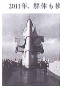
軍艦マンションの外観

ビルの正式名称は「旧第3スカイビル」。1970年竣工、地上14階、地下1階建ての建物だ。設計は「狂気の建築家」とも呼ばれていた渡辺洋治(1923-1983)。陸軍船舶兵出身という経歴を持ち、その影響がうかがえる独特のデザインの建築物をいくつも手がけている。